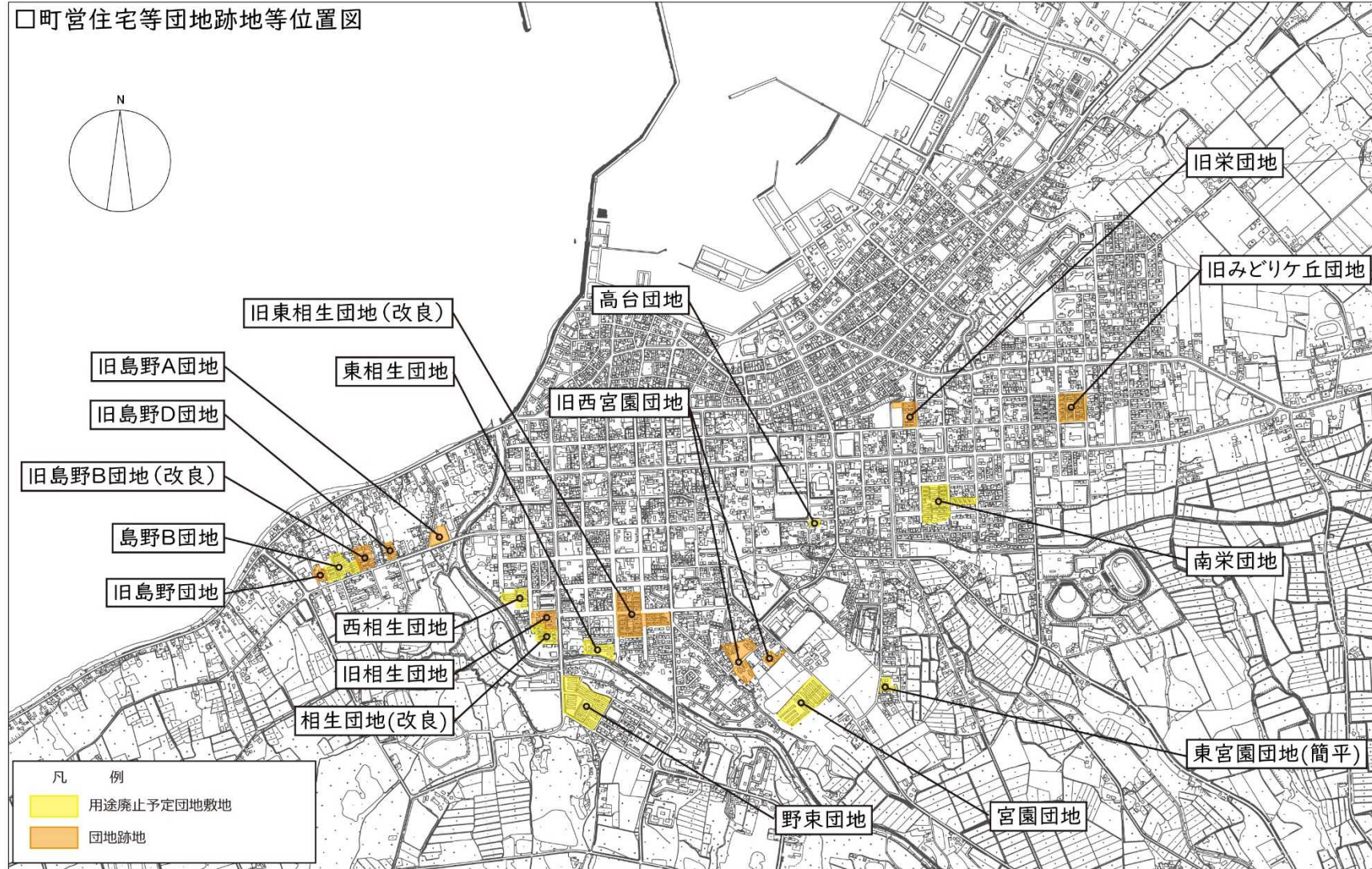
□町営住宅等団地跡地等位置図