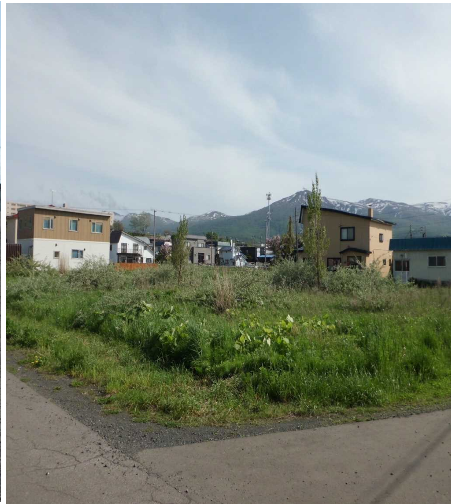
物件全景(土地北側から南西側へ撮影)