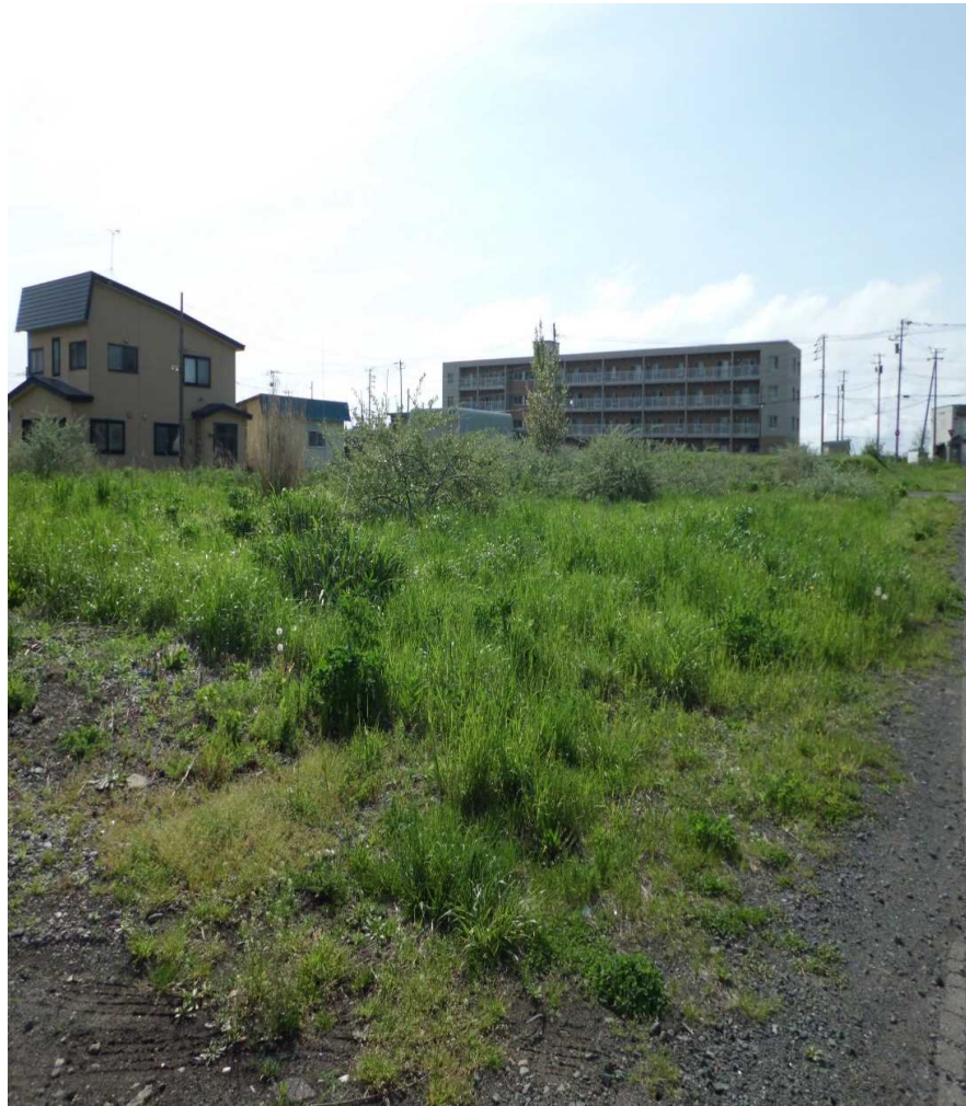
物件全景(土地東側から北西側へ撮影)