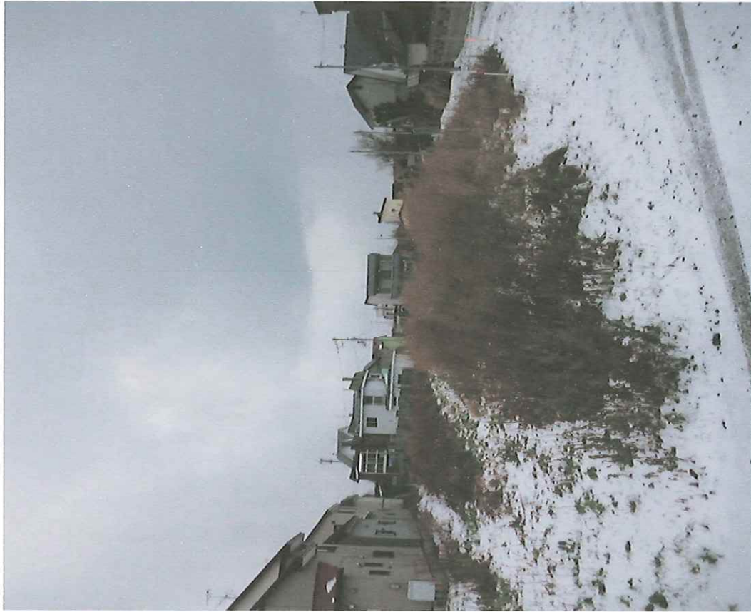
物件全景(土地南東側から北西側へ撮影)