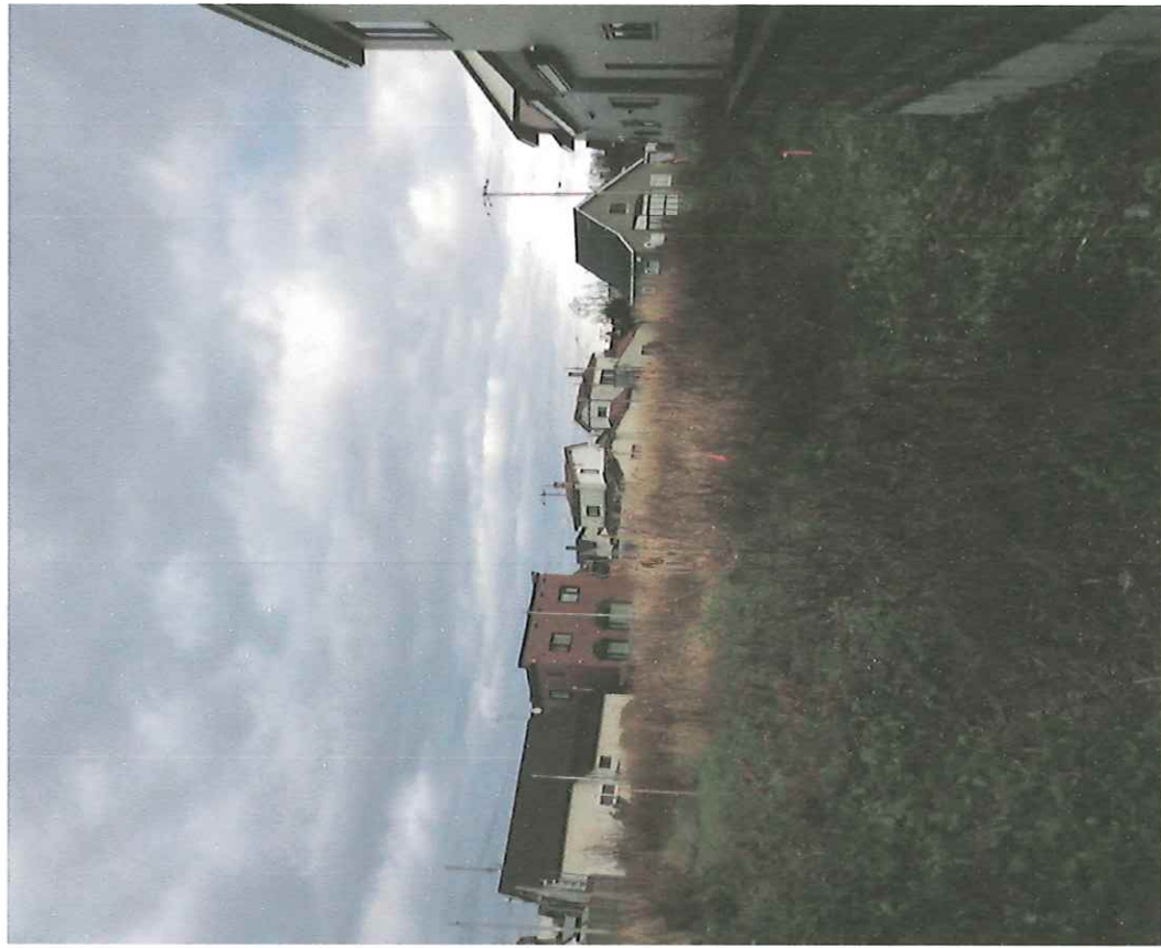
物件全景(土地北西側から南東側へ撮影)